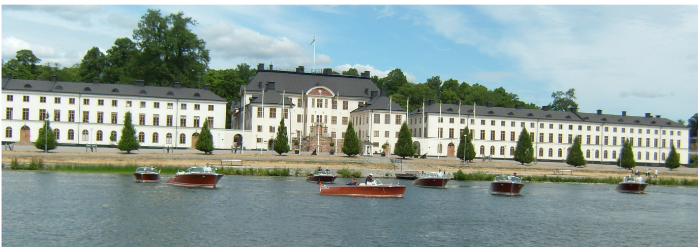
Tjusig vy framför Karlbergs slott, eller hur?