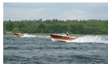
Full fart är aldrig fel!

Efter några smärre reparationer fortsatte vi mot Kyrkfjärden innanför Bogesundslandet. Fjärden, som mest liknar en insjö, kan bara nås genom ett mycket smalt sund i dess västra ände. Kyrkfjärden är en perfekt plats för badande och socialt umgänge på våra flytande Rivaflottar!