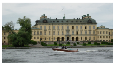
Drottningholms Kungliga slott