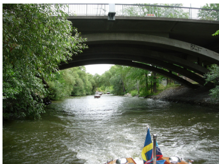
Karlbergskanalen i Stockholm.

Som tack bjöd vi deras klubbmedlemmar på en tur i några av Rivorna, vilket verkade uppskattas minst lika mycket!