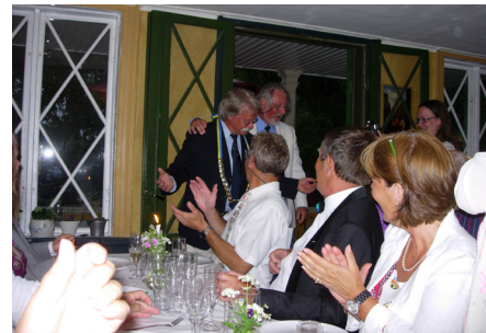
Gala middag och prisutdelning på Stora Henriksvik

Dagens lunch avnjöts på det gamla bågefiket Brostugan vid brofästet mot Drottningholm. På väg tillbaka kom veckans första regn, men som tur var hann alla hem innan helvetet brakade lös på riktigt!