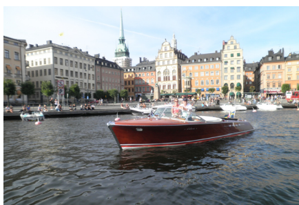
Glenn & Sussi framför "silltorget".

Efter välkomsttal av Tobbe, följt av en mycket god lunch, lämnade vi hamnen för en tur genom skärgården