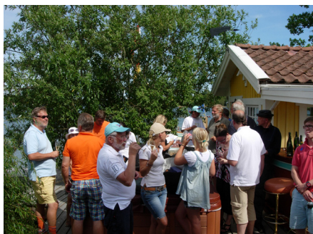
A tänk att ha en egen Rivabar...