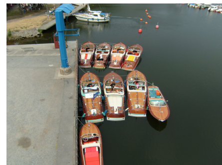
Bosö båtklubbns servicekaj.

Efter en slingrande färd bland öarna längs Värmdölandet landade vi på Bosö båtklubb på Lidingö för lite medhavd picnidlunch.