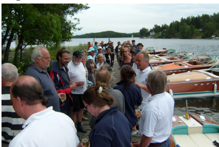
Skål i skumpa på Idskär.

Utan deras gästfrihet att låta oss nyttja deras bryggor hade detta möte aldrig varit möjligt att genomföra. För att visa vår tacksamhet hade vi bjudit in dem till deras egen klubbholme Idskär i Mälaren för en gemensam lunch som vi givetvis stod för.