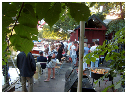
Grillkväll vid Pårsundet, glöms aldrig...