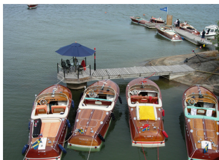
Tobbes nya hamn, bra jobbat!

I år var det huvudsakligen Svenska båtar som deltog, men vi kunde i alla fall räkna in två Tyska och en Dansk Riva. Allt som allt så blev det 11 Rivor som deltog i mötet.