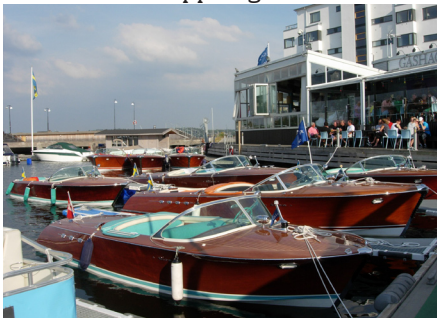
Middag på Bryggan, Lidingö.

Dagens tripp på ca 45 Nm avslutades vid 23-tiden då vi anlände Hammarbyslussen i lagom tid för att hinna med sista slussöppningen.